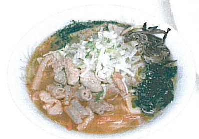
大吉名物みそもつラーメン 750円