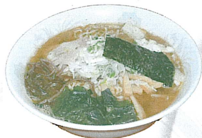
やみつき系魚吉ラーメン 700円