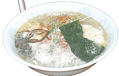
イタリアン風塩チーズラーメン 700円