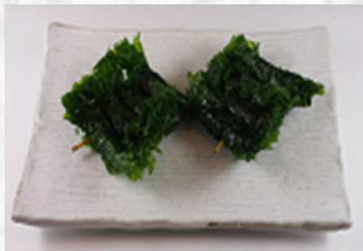
山形名物「しそ巻き」(2串) 480円 (税抜 444円)