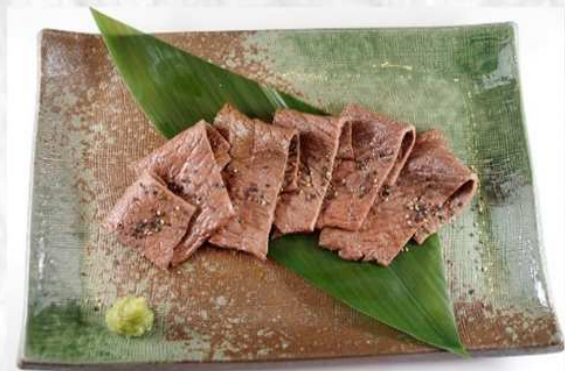
山形牛の炙り焼き 1,650円 (税抜 1,528円)