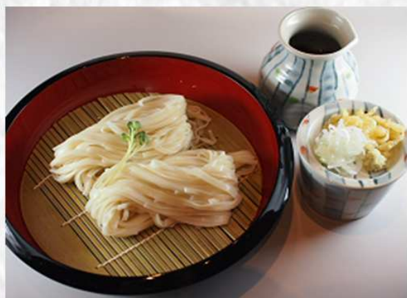
冷やし稲庭うどん