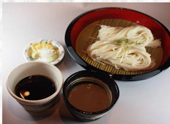
ごまと醤油の味くらべ