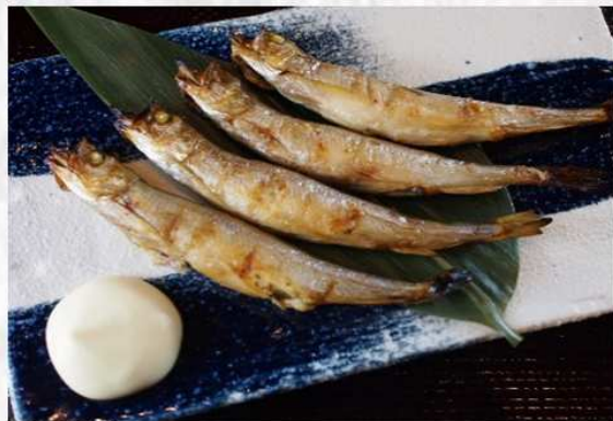
北海道産「本ししゃも」(4尾) 900円 (税抜 833円)