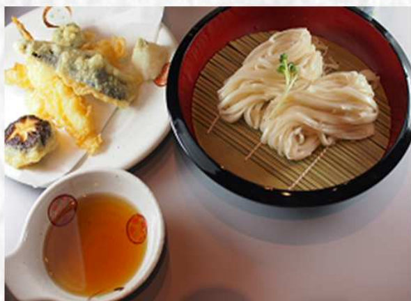
冷やしうどん・天ぷらセット