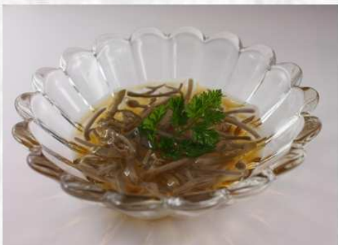
秋田県産「じゅん菜」 400円 (税抜 370円)